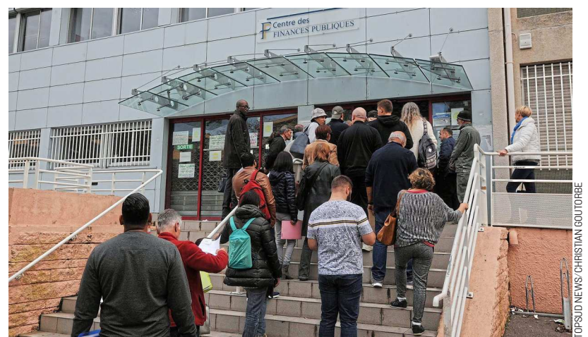
Perpignan (Pyrénées-Orientales), hier. Quelque 1 200 personnes se rendent chaque jour dans ce centre des impôts qui va bientôt perdre 15 postes.